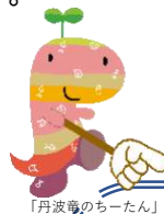
「丹波島のちーたん」