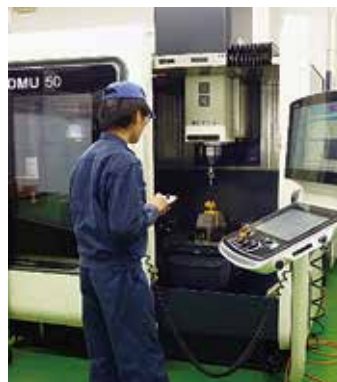
5軸マシニングセンタ