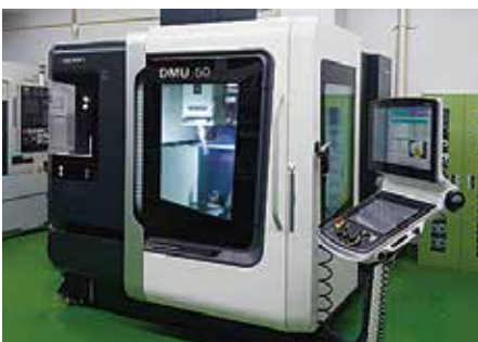
5軸マシニングセンタ