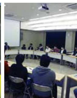
外部講師による特別授業