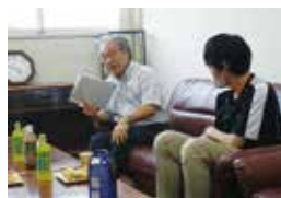
大学校長との懇談

「少ない燃料でより遠くまで」自動車部（Clean Diesel Team）は、ディーゼルエンジンを使って国内外の省エネカーレースに挑戦。車両や部品の設計・製作・評価、エンジンの評価・改良に取り組み、「但馬から世界へ…」を合い言葉に活動しています。